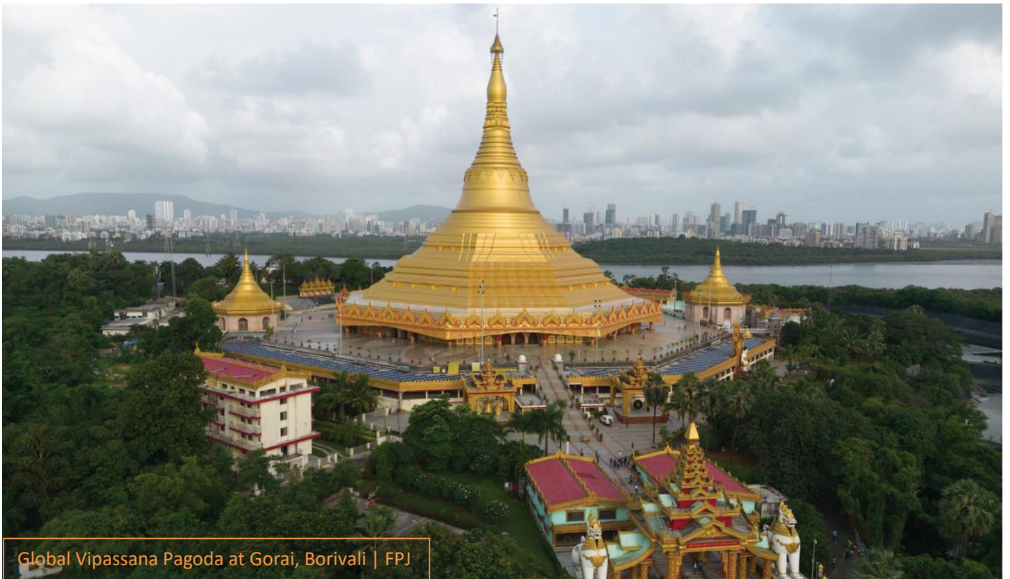
Global Vipassana Pagoda at Gorai, Borivali