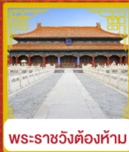
พระราชวังต้องห้าม