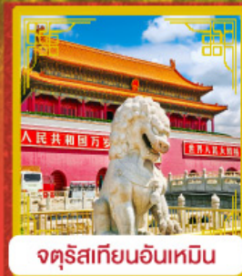
จัตุรัสเทียนอันเหมิน