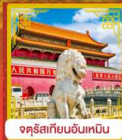
จตุรัสเทียนอันเหมิน