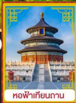
หอฟ้าเทียนถาน