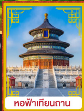
หอฟ้าเทียนถาน