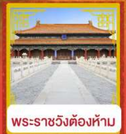
พระราชวังต้องห้าม