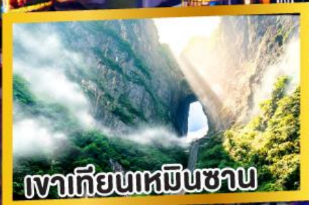
เขากีเยนเหมินชาน