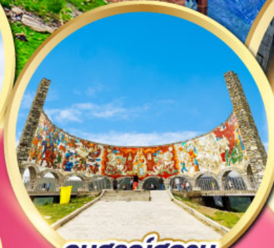
อนุสรณ์สถาน รัสเซีย-จอร์เจีย