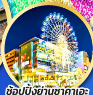
ช้อปปิ้งย่านซากาเอะ