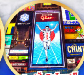
ช้อปปิ้งชินโซบาชิ