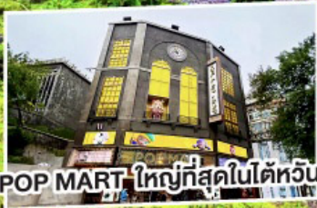
POP MART ใหญ่ที่สุดในไต้หวัน