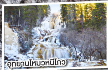
อุทยานโหมวหนี่โกว