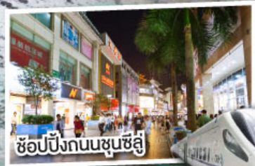
ช้อปปิ้งถนนชุนชี่