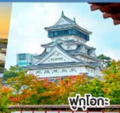
ฟุกุโอกะ