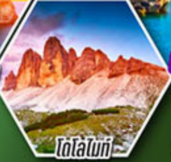
โดโลไมท์

โปรแกรมเดียว เก็บครบจบ อิตาลี ตั้งแต่เหนือถึงใต้