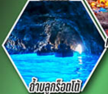
ถ้ำลูกรोटโต้