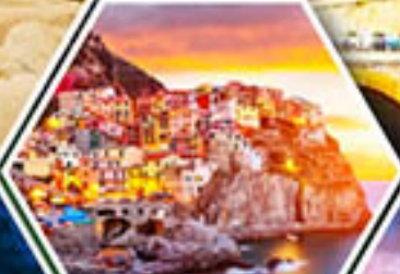
หมู่บ้านมาราโรลา