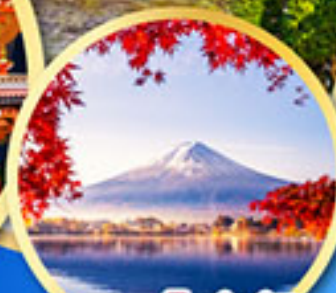
ภูเขาไฟฟูจิ