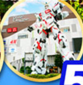
โดเวอร์ซิตีโอโดบะ