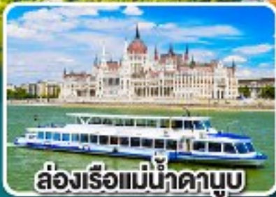
ล่องเรือแม่น้ำดานูบ