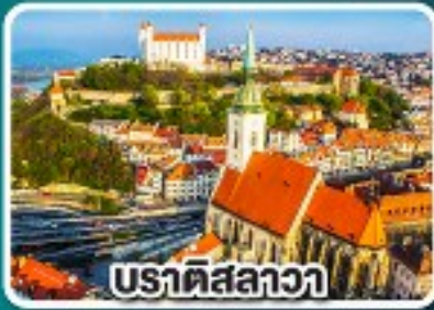
บราติสลาวา