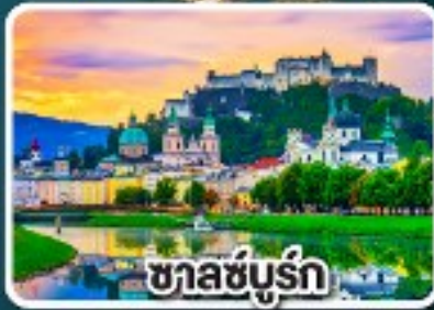
ซาลซ์บูร์ก

มือพิเศษแสนอร่อย เปิดปากกึ่ง , เปิดโบฮีเมีย และหมุกอดเวียนนา