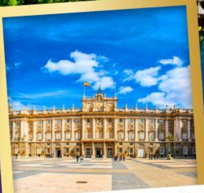
พระราชวังหลวงมาดริด