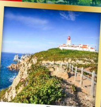
แหลมโรกา