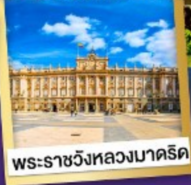
พระราชวังหลวงมาดริด