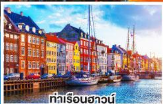
ท่าเรือฮาวน์

เดินทาง 19-26 พ.ย. 67 03-10 ธ.ค. 67 26 ธ.ค. 67-02 ม.ค. 68 (ปีใหม่)