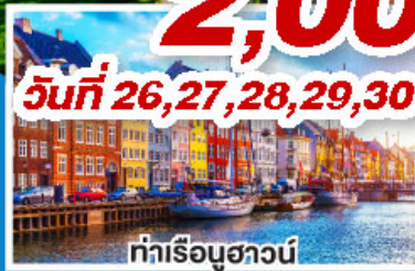
ท่าเรือชวาน์

ล่องเรือสำราญสุดหรู DFDS พร้อมห้องพักแบบ Sea View