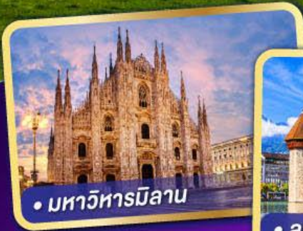
• มหาวิหารมิลาน