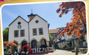
เทมส์ทาวน์