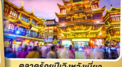
ตลาดร้อยปีเจียงหวงเมี่ยว

สนุกสนานไปกับเครื่องเล่น Shanghai Disneyland เต็มวัน