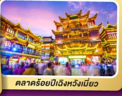
ตลาดร้อยปีเจียงหวงเหมียว

สนุกสุดมันส์ไปกับเครื่องเล่น Shanghai Disneyland เต็มวัน