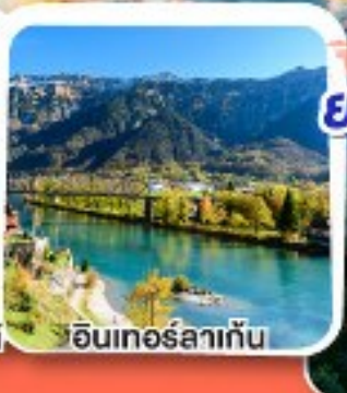
อินเทอร์ลาเก็น