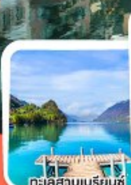
ทะเลสาบเบเรียนซ์

การบินได้ค้างคืนบนยอดเขาริเกิ ราชินีแห่งขุนเขาสวิส.