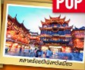
พระราชวังฤดูร้อนเป่ย์จิงหวงเหมียว