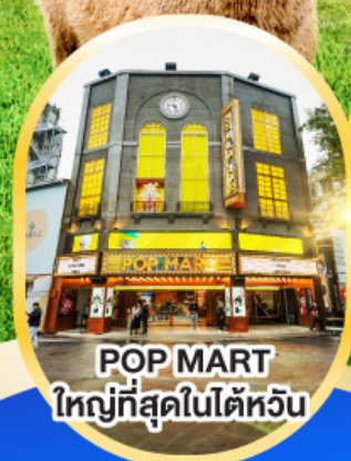
POP MART ใหญ่ที่สุดในไต้หวัน