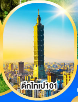
ตึกไท่เปี101