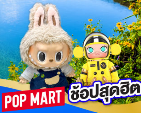
POP MART ซ้อปสุดฮิต