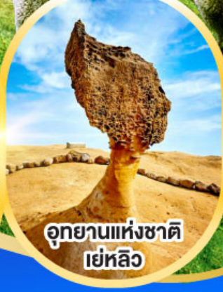
อุทยานแห่งชาติ เย่หลิว