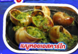
เมนูหอยแอสคาร์โท