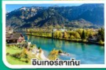
อินทอร์สลาเกิน