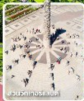
สวนจันทน์และน้ำแข็ง