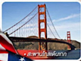
สะพานโกลเด้นเกต