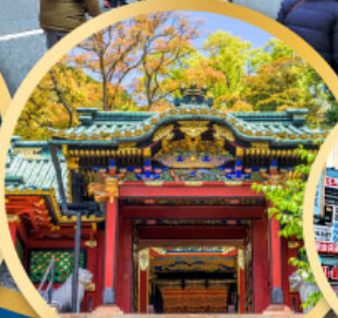
ศาลเจ้าโทโชคุ