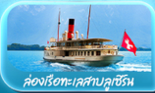
คองเรือทะเลสาบลูเซิร์น

ซูริก โลซาน เวเวย์ เซอร์แมท ลูเซิร์น ริกิ