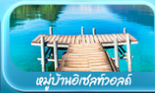
หมู่บ้านอิเชิลทออลด์