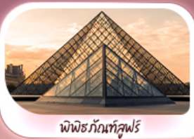
พิพิธภัณฑ์ลูฟร์