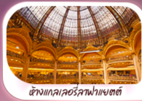
ห้างแลคซอร์ดาฟาเยตตี