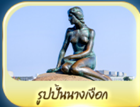
รูปปั้นนางเงือก