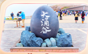
ชุมชนไร่ดำโอวาคุดานิ