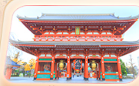
วัดฮาซากุสะ