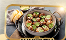
เมนูพิเศษ หอย Escargot