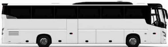
ตัวอย่างรูปภาพรถ 1 ชั้น

หากประเภทห้องที่ท่านริเคอสมาดูเกินจากที่ระบุไว้ เช่น ริเคอสห้องพักเป็น TWIN BED หรือ DOUBLE BED ทางบริษัทขอสงวนสิทธิ์ในการปรับประเภทห้องพัก เป็นตามโรงแรมที่มีอยู่ โดยไม่ต้องแจ้งให้ทราบล่วงหน้า