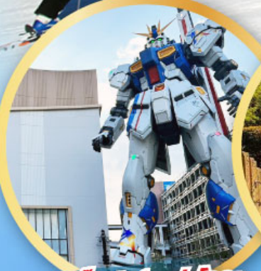
กันดั้ม ปาร์ค ฟุคุโอกะ

เดินทาง 09-13, 16-20, 23 -27 ม.ค.68 06-10,13-17, 20-24 ก.พ. 68 07-10 มี.ค. 68