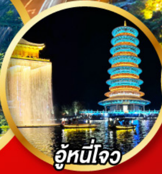
อู่หนี่โจว