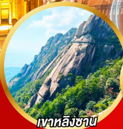
เขาหลิงซาน