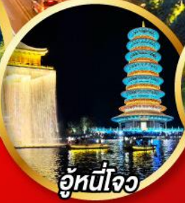
อู่หนี่โจว