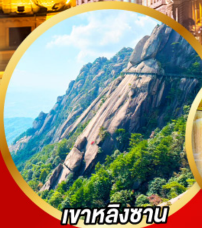
เงาหลิงซาน