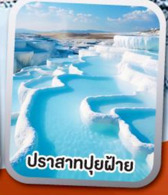
ปราสาทปูยฝาย