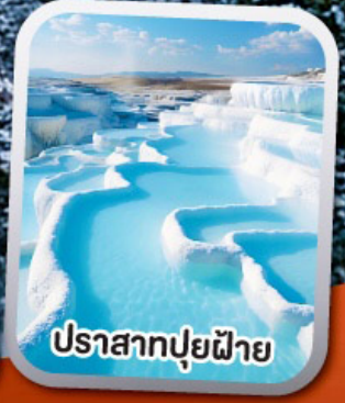
ปราสาทปุยฝ้าย