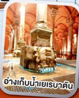
อ่างเก็บน้ำเยเรบาตัน