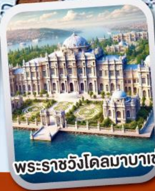
พระราชวังโดลมาบาเซ่