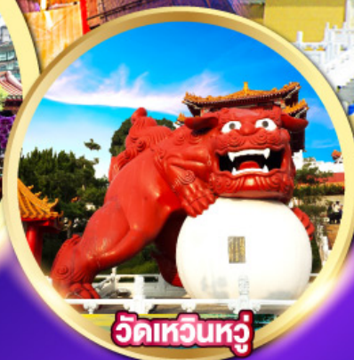
วัดเหวินหู่