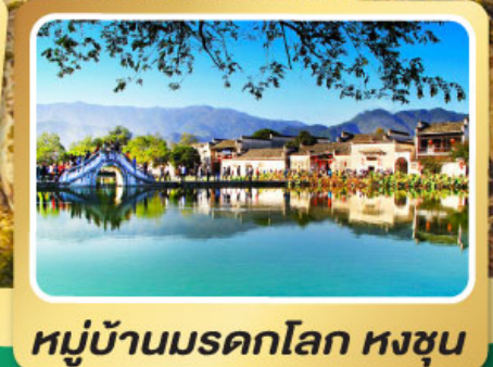
หมู่บ้านผดกโลก หงซุน