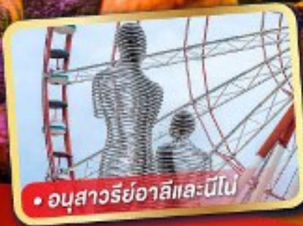
• อนุสาวรีย์อาลีและนีโอบี