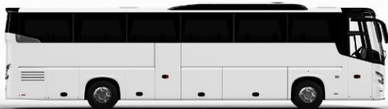
ตัวอย่างรูปภาพรถ 1 ชั้น

ค่าที่พักตามที่ระบุในรายการหรือเทียบเท่าระดับเดียวกัน (พักห้องละ 2 ท่าน) หากประเภทห้องที่ท่านริเวสมาเต็ม อาทิ เช่น ริเวสห้องพักเป็น TWIN BED หรือ DOUBLE BED ทางบริษัทขอสงวนสิทธิ์ในการปรับประเภทห้องพัก เป็นตามที่โรงแรมมีอยู่ โดยไม่ต้องแจ้งให้ทราบล่วงหน้า