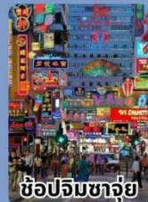
ช้อปปิ้งชาจู่ย