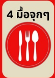
4 มื้อจุกๆ