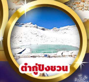
ท่ากู่ปิงชเวน