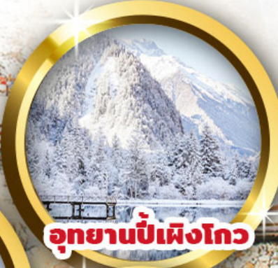
อุทยานปี้เฟิงโกว