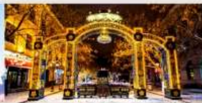
ถนนคนเดินจงหยาง

*ทางบริษัทฯ ขอสงวนสิทธิ์ในการลิสโปรแกรมทัวร์ตามความเหมาะสมขึ้นอยู่กับสถานการณ์หน้างาน โดยคำนึงถึงผลประโยชน์ของลูกค้าเป็นสำคัญ