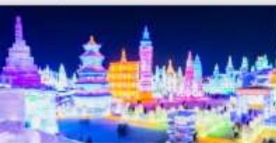
เทศกาลโคมไฟน้ำแข็ง