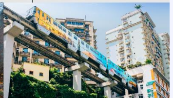
รถไฟฟ้าทะเลตึก

*ทางบริษัทฯ ขอสงวนสิทธิ์ในการสลับโปรแกรมทัวร์ตามความเหมาะสมขึ้นอยู่กับสถานการณ์หน้างาน โดยคำชี้แจงถึงผลประโยชน์ของลูกค้าเป็นสำคัญ