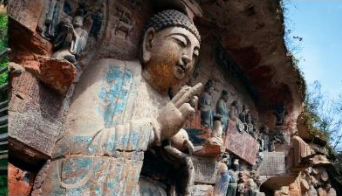
ผาหินแกะสลักต้าจู้ เขาเป่าติงซาน