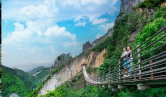
หุบเขารอยแยกอุ๋หลิงซาน