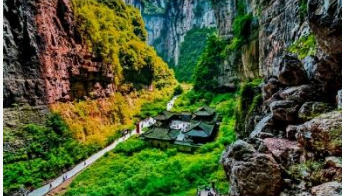
อุทยานแห่งชาติหลุมฟ้า 3 สะพานสวรรค์