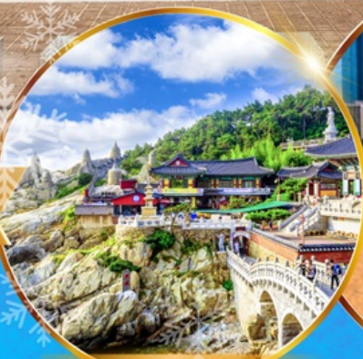
วัดแสงยงกุงซา