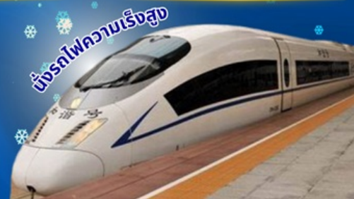
ขบวนไฟความเร็วสูง

พักโรงแรม 4 ดาว ★★★★★ บริการอาหารท้องถิ่น