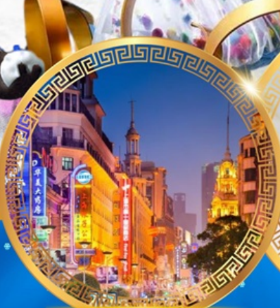
ถนนคนเดินหนานจิง