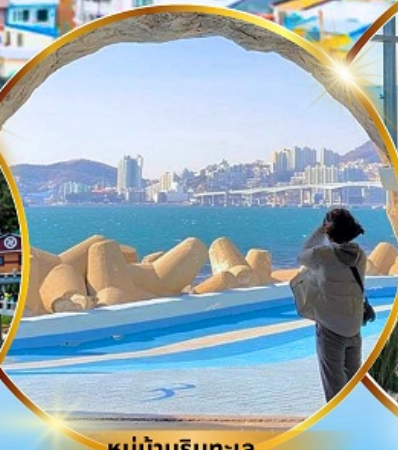
หมู่บ้านริมทะเล