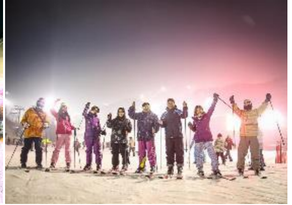
กางเกงที่เหมาะสม) ทุกท่านสามารถเล่นได้ไม่จำกัดเวลา