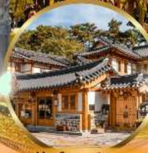
หมู่บ้านโบราณอินพยอง