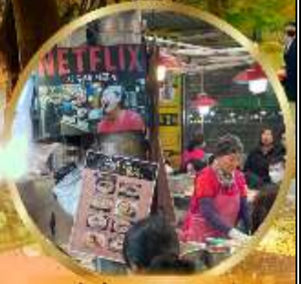
สตรีทฟู้ดตลาดกวางจ้ง