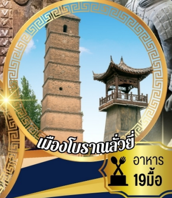
เมืองโบราณลั่วอี้