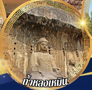
ถ้ำหลงเหมิน