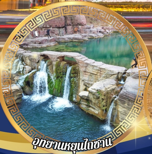
อุทยานหยุนไถซาน