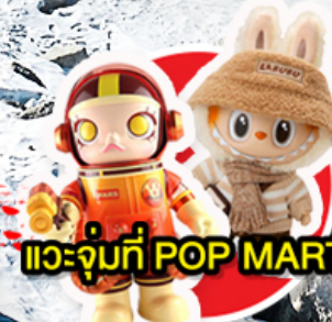
แวะจุ่มที่ POP MART