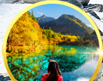
ชมความงดงาม อุทยานจิวจ้ายโกว