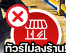
✗ ทีวีไม่ลงร้าน!